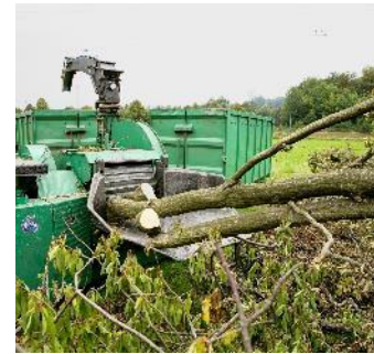
Investissement pour la filière bocagère de valorisation durable

AAP national commun avec les pépinières et semenciers forestières et agroforestières avec instruction D(R)AAF/SERFOB