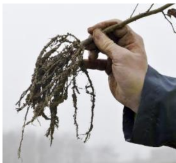
Production de graines et plants ligneux