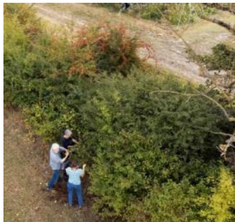
Accompagnement à la plantation et à la gestion durable