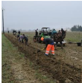
Investissement à l'implantation de haies et d'arbres intraparcellaires