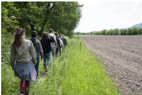
Formation : Projet CAP'Haie DGER – Bergerie Nationale de Rambouillet