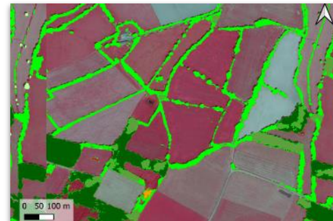
Observatoire de la Haie IGN, INRAE, OFB