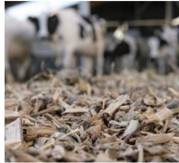
Animation pour la filière bocagère de valorisation durable